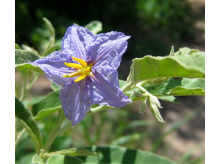
Trompillo ( Solanum elaeagnifolium )