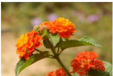
Lantana ( Lantana sp. )