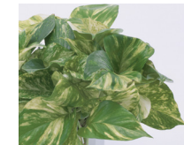
La hiedra del diablo ( Epipremnum aureum )