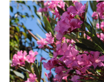
Adelfa ( Nerium oleander )