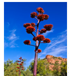
Agave ( Agave Americana )