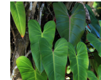
Filodendro ( Philodendron species )