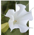
Estramonio ( Datura Stramonium )