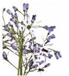
Lila de la chinaberry ( Melia Azedarach )