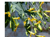
Tobaco arbol ( Nicotiana Glauca )