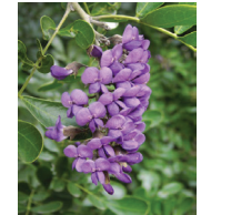
Mezcal frijol ( Sophora secundiflora )